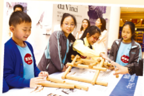
同學們有機會接觸復原品，感到非常興奮。

是次展覽展出了 6 幅精通藝術與科技的偉大博學者——李安納度·達文西的珍貴手稿真跡，當中的精密設計叫人嘖嘖稱奇。此外，現場擺放了由意大利國家級達文西博物館，依照達文西的發明手稿所製作的樂器，以及軍事民生等模型及復原品，真使人大開眼界！