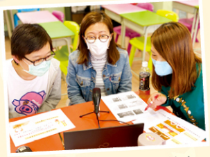
老師們化身 DJ，錄製故事。

除了透過文字的形式，也會在網上教材加入老師們的聲情演繹。老師們化身為 DJ，錄製不同的教材，好讓同學能夠更了解學習的內容。這班臨時 DJ 往往 NG 頻生，錄製五分鐘的影片，便要花上數小時，還有前期和後期的製作及剪輯，真是花盡心思呢！