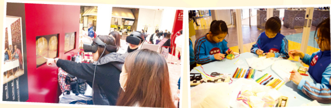
同學們參與展覽的不同活動體驗，樂在其中。

另外，在「我的蒙娜麗莎微笑」拍攝區，我們都變身成為蒙娜麗莎，非常有趣。是次參觀真叫人大開眼界！