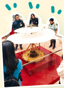
展覽重現達文西手稿的模型，令人讚嘆。

一月時，視藝科老師及二十名同學分別前往奧海城參觀首次在亞洲舉辦的《想·像達文西 500 週年展》展覽。