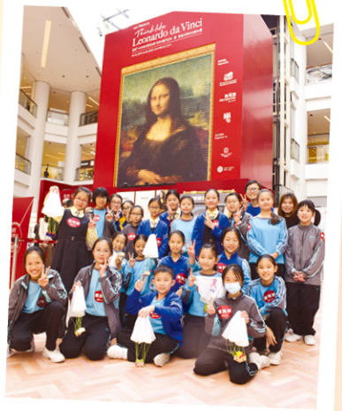
老師帶領同學們一同參觀展覽

另外，在「我的蒙娜麗莎微笑」拍攝區，我們都變身成為蒙娜麗莎，非常有趣。是次參觀真叫人大開眼界！