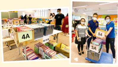
老師們把實體功課由教室運送至地下會議室，以便安排運送。